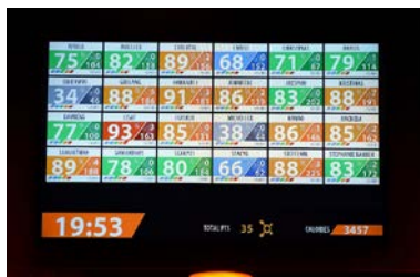
<スタジオ内大型ハートレートモニター>