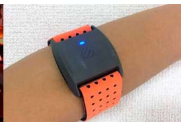
<オリジナルのハートレートセンサーを腕に着用>

オレンジセオリーフィットネスのワークアウトは、トレッドミル、ローイングマシン、ファンクショナルトレーニングを組み合わせた、 1時間のトータルボディワークアウト です。参加者がオリジナルのハートレート(心拍数)センサーを着用することで、スタジオ内に設置された大型ハートレートモニターに 各自の心拍数や消費カロリーがリアルタイムで表示 されます。心拍数はレベルによって5つのカラーゾーン(グレー・ブルー・グリーン・オレンジ・レッド)に分けられ、最大心拍数の84%以上である「オレンジゾーン」と「レッドゾーン」の中に計12分以上入ることを目標にします。