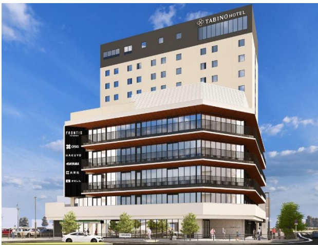
（建物外観 完成イメージ）

これに伴い、「たびのホテル lit（リット）豊川」および多目的ホール「FRONTIS FORUM（フロンティスフォーラム）」の予約受付を、5月15日（金）正午より開始いたします。