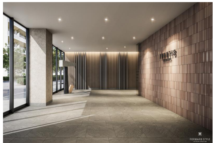
（オフィスエントランス 完成イメージ）